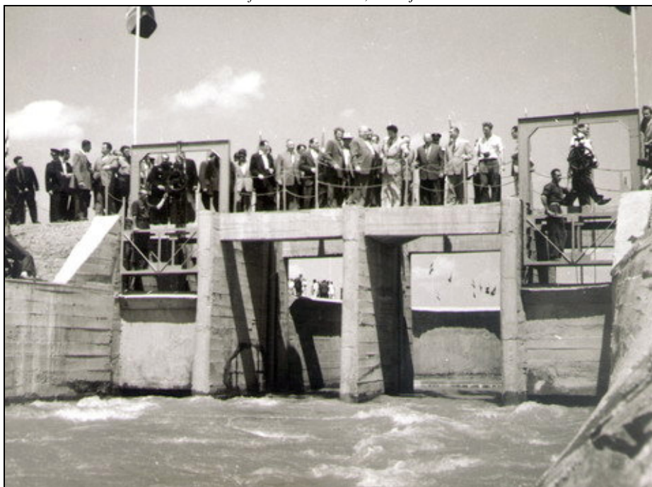
A Keleti-főcsatorna avatása, 1956. július 14.

A vízlépcső létesítményeit több mint 1000 politikai fogoly, internáltak és néhány polgári alkalmazott építette, de a korábitól eltérő formában és felfogásban. A munkálatok az Államvédelmi Hatóság szigorúan zárt szervezésében folytak. A Keleti-főcsatorna építését 1951-től 1956-ig folyamatosan végezték, kivitelezője a Vízügyi Építő Vállalat volt. A bakonszegi leeresztő zsilip 1956 júliusára készült el, s 1956. július 14-én itt ünnepelték a főcsatorna építésének befejezését. A Keleti-főcsatornát Erdei Ferenc, a minisztertanács elnökhelyettese avatta fel.