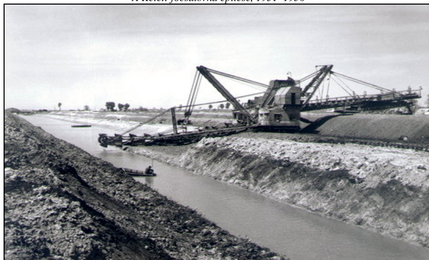
A Keleti-főcsatorna építése, 1951–1956

A részlettervek elkészítése után, még a második világháború alatt megkezdődtek a kivitelezés kezdeti munkálatai, 1941. augusztus 8-án beindították a főcsatorna 21,1–44,9 km közötti szelvényeinek építését, s 1944. október elején elkészült fél szelvénnel a 20,3–44,9 km közötti szakasz. Amikor a második világháború vihara elérte hazánkat, a munkákat abbahagyták és a főcsatorna építését csak 1951-ben folytatták. A főcsatorna földmunkáját egy sínen járó, merítékkotrós UM-2 kotrógép végezte, a földmunka teljesen gépesített volt. Szkréperek, lépkedő kotrók, vonóköteles forgó-felsővázás kotrógépek, valamint dózerek, dömperek és egyéb segédgépek komplex géplánca dolgozott. A főcsatorna teljes hosszában kereken 9 millió \text{m}^3 föld megmozgatására volt szükség.