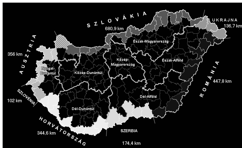
1. ábra: Határ menti térségek Magyarországon

A határmentiség megkülönböztetett jelentőséggel bír Magyarország esetében, ahol az ország elhelyezkedésénél fogva az átlagosnál is több az államhatárok érintkezése. Mintegy 2242 km hosszú államhatára mentén Magyarország hét országgal szomszédos, a nagyrégiók – köztük az Észak-alföldi régió – mindegyike, a 19 megye közül 14, a 174 kistérség egyharmada közvetlenül érintkezik valamelyik államhatárral. A települések tíz százaléka közvetlen határ menti, 43%-a határközeli fekvésű, az ország területének és népességének pedig több mint egyharmada határregiókban helyezkedik el (1. ábra).