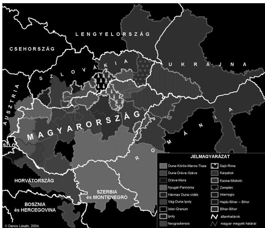
3. ábra: Eurorégiók és határon átnyúló interregionális együttműködések Magyarország részvételével

A határmentiségben és a határon átnyúló kapcsolatokban az európai integrációs és globalizációs folyamatok kiteljesedésével kettős tendencia figyelhető meg. Az egyik abban mutatkozik, hogy a különféle eurorégiós és interregionális szervezetek – lassan csökkenő szerepkel – a jövőben is a határ menti együttműködések, illetve a határon átnyúló kapcsolatok fejlesztésének eredményes formái maradhatnak. A korábban intézményesült eurorégió-típusú határközi együttműködések – azon túl, hogy elősegíthetik az uniós források megszerzését és hatékonyabb felhasználását –, jelentős mértékben hozzájárulhatnak Magyarország politikai és gazdasági pozíciójának átrendezéséhez a Kárpát-medencében (3. ábra).