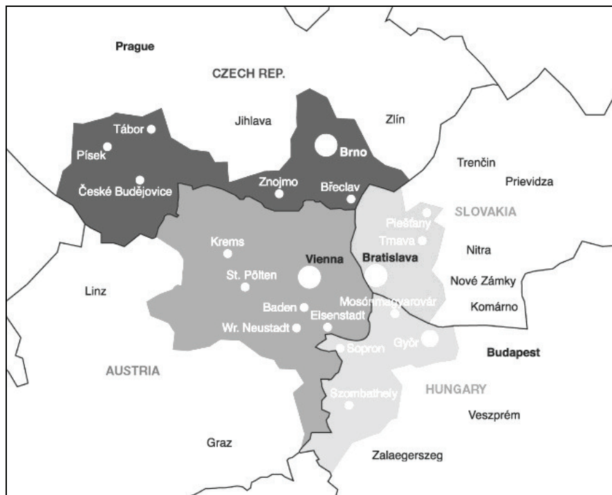
5. ábra: A Centrope region elhelyezkedése

A különböző megújult határközi együttműködések és intézményi struktúrák, inter-regionális szervezetek minden problémájuk ellenére a határon átvelő kapcsolatok olyan új intézményesült keretei, amelyek eredményesen szolgálhatják az uniós források megszerzését, hatékonyabb felhasználását, mindenekelőtt pedig a közvetlen kapcsolatok és helyi erőforrások kiaknázásában rejlő lehetőségeket, amelyek mérsékelhetik a Magyarország Európai Unió és schengeni csatlakozásával létrejött külső határok kedvezőtlen hatásait. A határon átnyúló kapcsolatokban bekövetkező, egyre nyilvánvalóbb paradigmaváltás nyomán, Magyarország és mindenekelőtt a belső államhatárok mellett elhelyezkedő szomszédai esetében a határrégiók és a határon átnyúló együttműködések hatékonyabban segíthetik elő a határrégiók közötti összekötő (híd-) szerep megszilárdulását, hajdanvolt integrációs kapcsolatok újjászerveződését, a Trianon folytán széttöredezett térszerkezeti egységek újraegyesítését , optimális esetben pedig távlatosan egy új Kárpát-medencei transznacionális makroregionális gazdasági térség létrejöttét, erősítve Kárpát-medence gazdasági-társadalmi kohézióját .