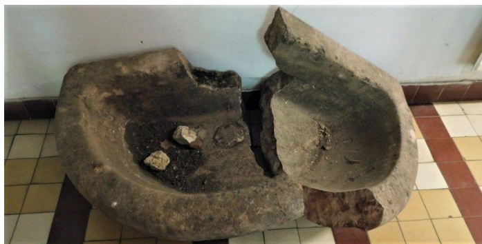
A keresztelő medence