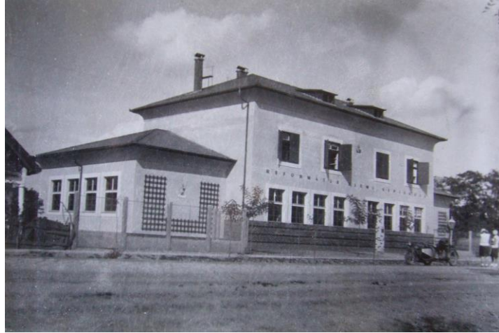
A tiszacsegei népiskola