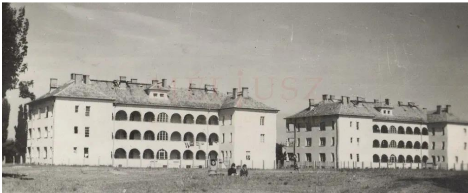
A Dobozi utca 6. és 8. számú ház udvar felőli oldala az átépítés előtt

Nevéhez fűződik a Debrecenben a Dobozi utcán 1942-ben elkezdett, de a háború miatt csak 1948-ra felépült két, kétemeletes bérház is. Nagyon szép arányos épület volt, főleg az udvar felől, íves folyosóival a tornácos parasztházakra emlékeztetett. Az 1970-es évektől több átalakításon esett át. Szilárd falaira két emeletet húztak fel, lapos tetős lett, a klinkertéglás díszítést levették. 3