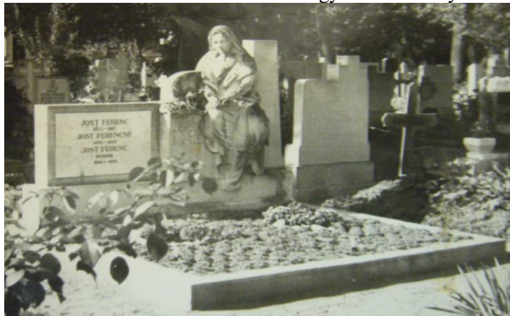
A régi síremlék