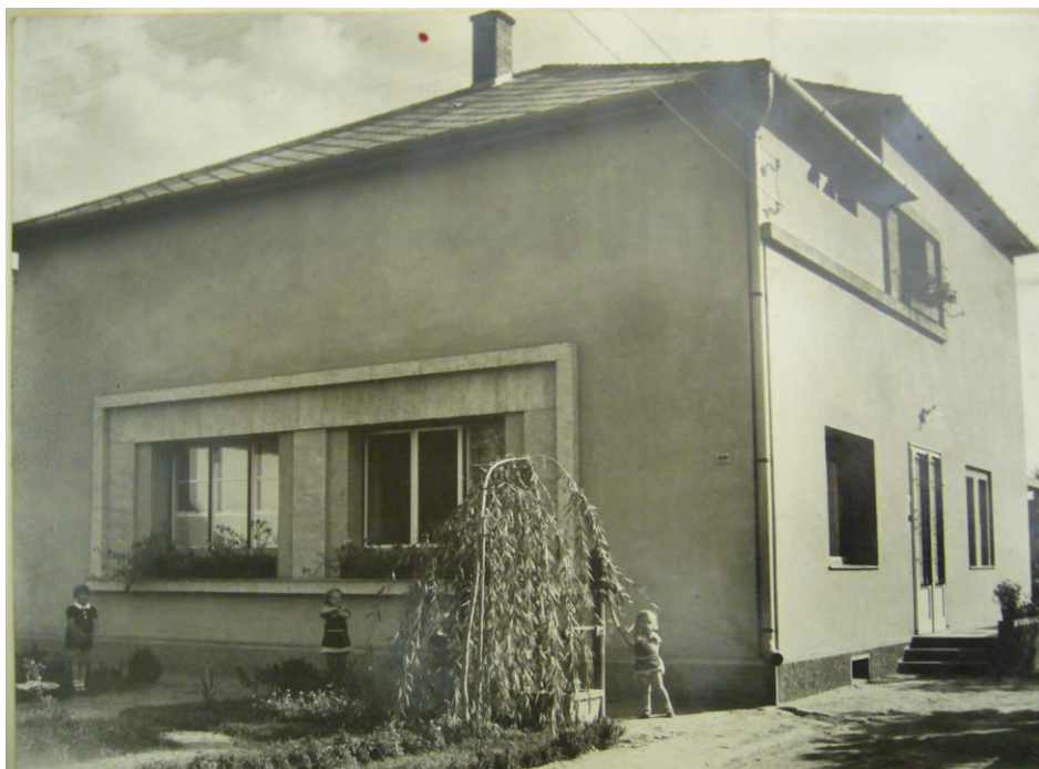
Az eredeti Thurzó-ház, Balmazújváros

A Thurzó család 1944-ig lakott a házban. 1945-ben pártház, majd szülőotthon lett. Jelenleg családsegítő szolgálat működik benne. Az épületet időközben átalakították, az erkély eltűnt és toldalékpülettel bővült. Ma már rá sem lehet ismerni az eredeti épületre.