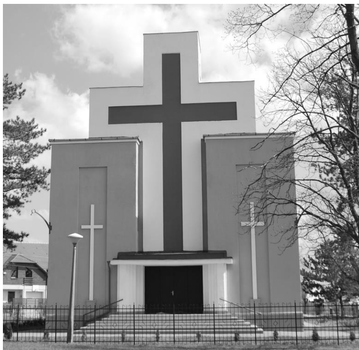
A csapókerti Jézus Szíve római katolikus templom

1934 és 1936 között saját tervei alapján felépítette a csapókerti római katolikus Jézus Szíve templomot, majd 1938-ban a nyilastelepi (ma Szabadság telep) Szent István templomot. 1947-ben még nekikezdett a Bem tér–Hadházi út sarkán a Szent László templom építésének is, de 1948 elejétől fenyegetésekkel, mindenféle koholt vádakkal támadták. A templom építését leállították, így még 35 évig a Füredi úti régi szükség kápolnában tartották az egyházi szertartásokat, a szentmiséket is beleértve. 2