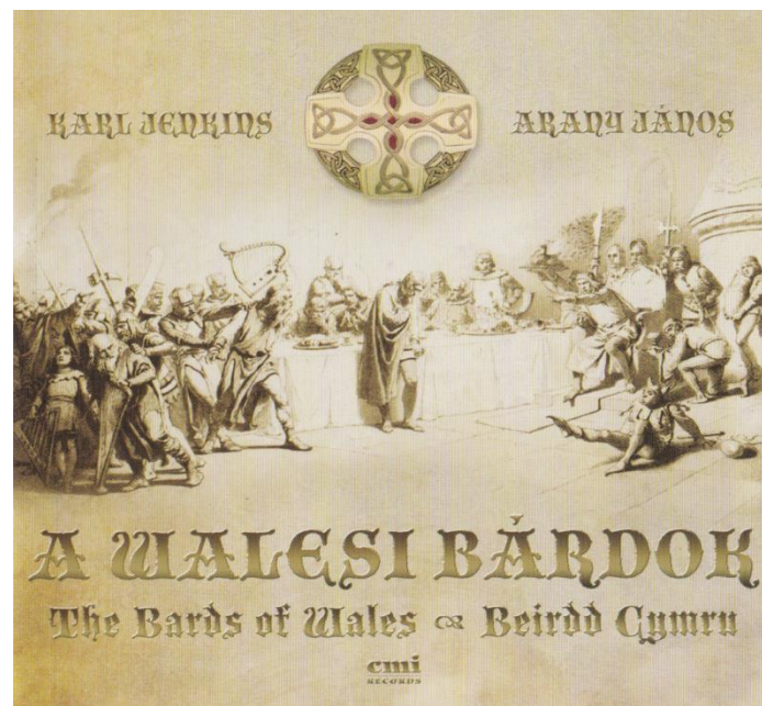
A Jenkins-CD borítója