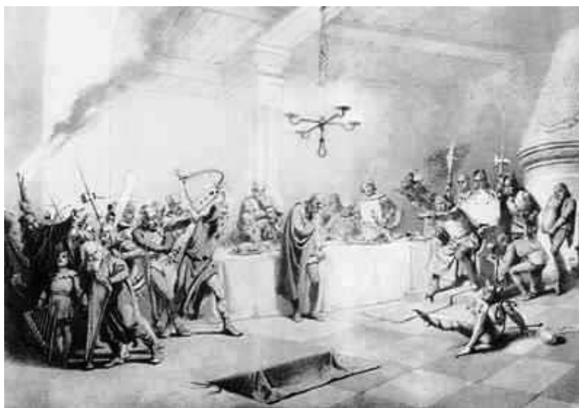
Zichy Mihály: Illusztráció a Walesi bárdokhoz

A Boosey&Hawkes kiadó honlapjának részlete