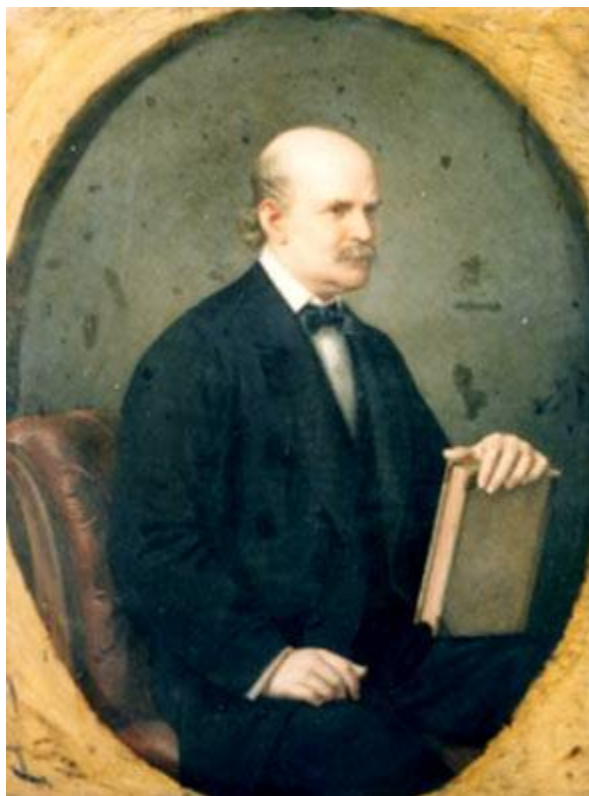
Semmelweis Ignác (1818–1865) (Than Mór festménye. A Semmelweis Egyetem tulajdona.)