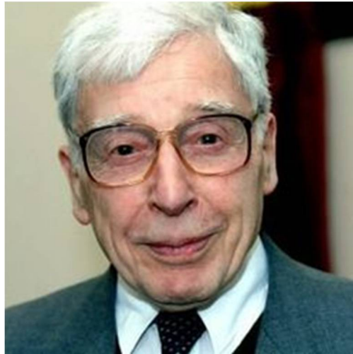
Sir Robert G. Edwards (1925–2013)

Ha Bob Edwards indulását vesszük görcső alá, őt korántsem taposta meg ennyire az élet és nem vette körbe ekkora mértékű értetlenség és ellenséges hangulat, bár az ő szakmai útja sem volt akadályoktól mentes. Mily viszonyom között látta meg napvilágot Edwards, ha Semmelweis szemszögéből nézzük? Jeles írónk „őrtjáratozott” London egyik anglikán templomában valamikor 1936-ban, az egyik márványtáblát betűzte olvashatta: „... who died ....in the 21 th Year of her age, Leaving an infant daughter aged three weeks ”. Majd így folytatja: „Egyszóval, meghalt, gyermekági lázban, huszonegy éves korában. Mint annyian, akkor és ma is, a fiatal Elizabeth Jane-k, mert ezeknek hiába élt, kutatott és örült meg Semmelweis; a gyermekági halálozás statisztikája Belgium után ma is itt a legrosszabb.”