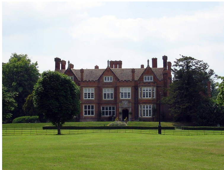
A Bourn Hall Klinika – a bölcső

American Journal of Obstetrics and Gynecology oldalain. A technika hihetetlen gyorsan terjedt világszerte, sorra születtek a lombikbábik (Ausztrália – Melbourne, 1979; USA – Norfolk, 1981; Franciaország – Clamart, 1982; Németország, Ausztria és Svédország – 1982). Újabb fertilizációs technikákat és módszereket alkottak meg (krioprezerváció, preimplantációs genetikai diagnosztika heréből nyert spermiumokkal végzett fertilizáció, ultrahang vezérelt petesejtnyerés, lézer alkalmazása, intracitoplazmatikus spermium injicálás, vitifikáció stb.) és 2017-re becslések szerint már hat és félmillióra rúgott azok száma, akik lombikprogramnak köszönhetően fogantak és látták meg a napvilágot. Szerinte a világon gomba módra szaporodtak az IVF intézetek, és a képzés is szétszórt a világ egyéb intézetei között, a Bourn Hall jelentősége is csökkent. A kilencvenes évek elején a mikromanipuláció, ill. az intracitoplazmatikus spermium injicálás bevezetésével a képzés központja Brüsszelbe tevődött át, de Bourn Hall ba eljutni és részt venni egy-egy kurzuson élményt és megbecsülést jelentett. S mindezek mérőkövek Edwards szemei előtt bújtak elő és növekedtek, jóleső, szívet melengető érzéssel figyelhette az általa kirobbantott reprodukciós forradalmat. Bárhogy is alakult a reprodukciós világ, az primus inter pares csupán egy nevet jelenthetett: Sir Robert G. Edwardsét.