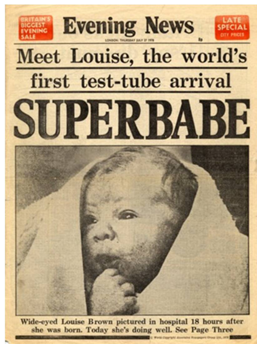
Az első lombikbébi az Evening News címlapján

kötelezték őket. Számos filozófus, klinikus és tudós (köztük két Nobel-díjas) a nyomtatott sajtóban is megjelentette ellenvéleményét és kritikai észrevételeit az in vitro fertilizációval szemben. Ekkor az oldhami Etikai Bizottság segítette ki őket: labort és egy ágyat biztosított egy kis helyi kórházban. Az első lombikbébihez egy méhen kívüli terhességen vezetett az út, de a kétkedők és ellendrukkek hadát elcsöndesítette 1978. július 25-dike: megszületett Louise Brown, az első „lombikbébi”, akit 38 héttel korábban, 8 sejtés embrionális állapotában ültettek be az anyaméhbe. (A történet külön szépsége, hogy 2004-ben Edwards részt vett Louise esküvőjén, akinek házasságából – természetes fogantatással – két gyermek született.)