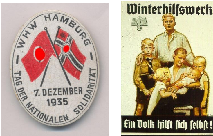
Egy hamburgi télisegély program jelvénye. „1935. december 7. – A nemzeti szolidaritás napja.” 29

forma.” 26 1936. december 1-én törvénybe is iktatták a téli segély programját. „A német nép téli segélyszolgálatát a birodalmi propaganda- és népfelvilágosítási miniszter vezeti és felügyeli. A Führer és birodalmi kancellár az ő javaslatára nevezi ki és menti fel a német nép téli segélyszolgálatának megbízottját.” 27 A segélygyűjtés helyszínei lettek az üzemek, az utcák, de házról házra is jártak az aktivisták, akik száma elérte az egymilliót. Az adakozók a felajánlásokért jelvényt kaptak, az 1934/1935. év fordulóján 31 millió darabot gyártottak belőle, az 1938/1939. évben pedig már 170 milliót. 28