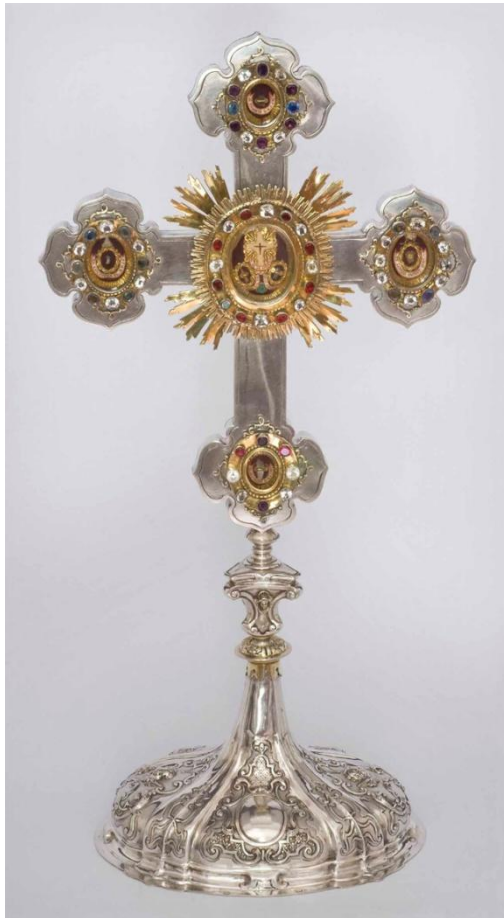
2. kép: Bjelik Imre tábori püspök oltárkeresztje

Az utolsó emlék-együttest az apácamunkák képviselik. Ezek célja az volt, hogy különféle ereklyéknek minél díszesebb foglalatokat készítsenek gyöngyökkel, csipkéekkel, fonatokkal, és ezeket képeretben helyezték el. Összesen 3 munka szerepel a kiállításon, amelyek mindegyikét a Szent Orsolya-rend nagyváradi zárdájában készítették a 18–19. század folyamán. A legkorábbi közülük ókeresztény szentek ereklyéit tartalmazza (3. kép). A díszes barokk keretben fehér selyem alagra vannak helyezve az ereklyék és az azokat keretező kézimunkák. Középpontban a Szent Szív, fölötte aranyfólián tövis, alatta Merici Szent Angéla-kép látható. Az ereklyetartó szélén kis textiltsakokban ókeresztény szentek ereklyéi sorakoznak felirattal ellátva: S. Fortunati, S. Venerandae, S. Generosi, S. Victoriae, S. Urbani. Többnyire a római Callixtus-katakombából származnak, melyből XIV. Benedek pápa exhumálta a szentek földi maradványait.