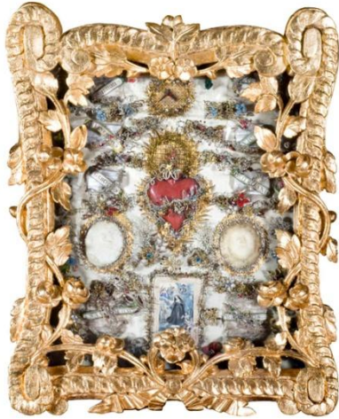
2. kép: Apácamunka ókeresztény szentek ereklyéivel.