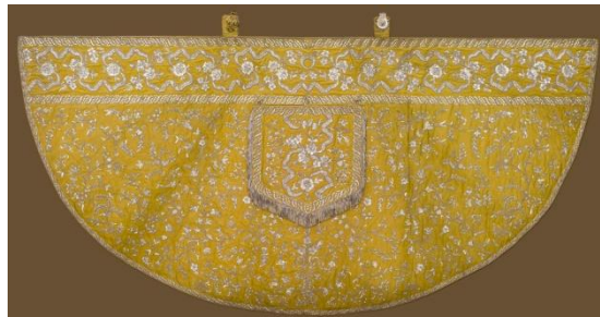
3. kép: Mária Teréziától kapott palást.

A kötet egészéről azt mondhatjuk, hogy az eseményhez és a gyűjteményhez méltó kivitelben készült el. A kiállítási installáció kitűnően sikerült. A tárgyakról precíz leírásokat és kifogástalan minőségű felvételeket találhatunk. Használatával sokkal inkább kitárulnak szemünk előtt a bemutatott darabok részletei és titkai. Talán az ötvösmunkákhoz készülhetett volna olyan általános bevezetés, mint amilyen a liturgikus textíliákat mutatja be. Azt pedig különösen sajnálhatjuk, hogy a katalógus nem készült el a kiállítás megnyitójára, mert bizonyosan sokakat segített volna a bemutatott darabok megismerésében és megértésében. Megjelentetése azonban így is méltó módon segíti elő az emlékezést a korábban látott kiállításra. A két püspökséget és a Déri Múzeumot, a katalóguson dolgozó szakembereket természetesen így is elismerés illeti, hogy a kálvinista Rómába elhozták és bemutatták ezt a páratlan szépségű gyűjteményt.