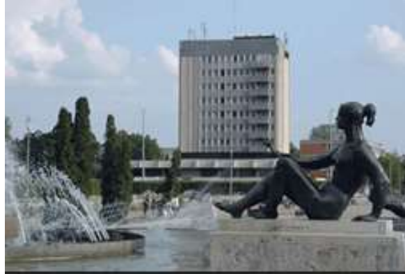
A Zeneművészeti Kar épülete

Az épületben könyvtár, hangszerész műhely és gondnoki szolgálati lakás is volt, ez utóbbiból később az egészségmegőrzés helyszíne, kondicionáló terem lett.