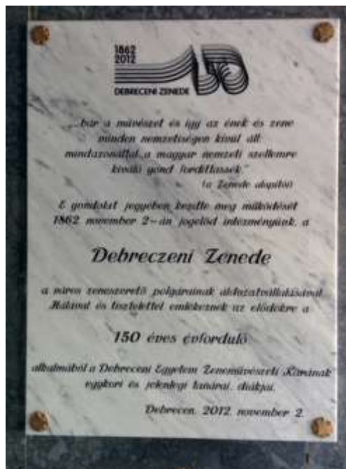
Emléktábla a Zeneművészeti Kar épületében