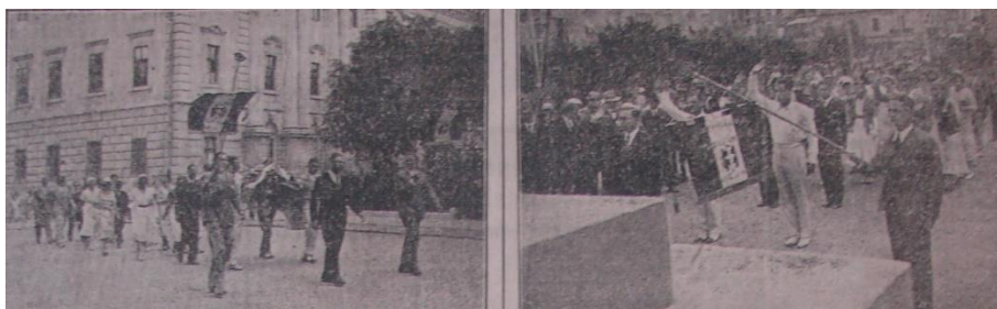
A Nyári Egyetem olasz hallgatói megkoszorúzzák a Kossuth-szobrot, 1931.