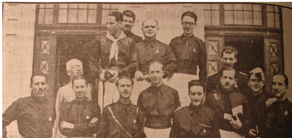
Olaszok a Nyári Egyetemen, 1936.

Magyarország ismét nagy, szabad, hatalmas!” A sorozat végén a város díszvacsorát adott az olasz gróf tiszteletére az Arany Bika éttermében. 18