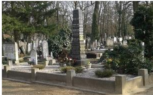
8. kép. A Koszorús család márványoszlopos síremléke a Debreceni Köztemetőben

A Debreceni Református Kollégiumban két éve készítettek egy dicsőségtáblát, amelyre fölírták az iskola 100 leghíresebb diákjának nevét. Mivel többen lemaradtak róla, célszerű és időszerű, mi több illő volna egy másik táblát is tervezni, ahová az újabb száz híres diák neve kerülhetne föl. Közéjük érdemes volna Koszorús Ferenc vezérkari ezredes, posztumusz vezérezredes nevét is fölírni, mert ennél magasabb tisztség a Magyar Honvédség rangsorában nincs. 2014. július 3-án a honvédelmi miniszter által adományozható legmagasabb kitüntetést, a Hazáért érdemjelet is megkapta, melyet a családja vehetett át. A Debreceni Kollégium diákjának, az immár legmagasabb rangú magyar honvédtisztnek méltán emeltek szobrot Budapesten! 31