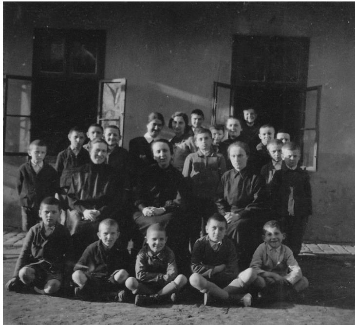
A tanítványok és nevelők az árvaház udvarán az 1930-as években (DNyEL)

házfőnök nővérrel. Később bekapcsolódtak a város szegényeinek gondozásába is. A nővérek száma 1933-ban 4 fő volt. 9